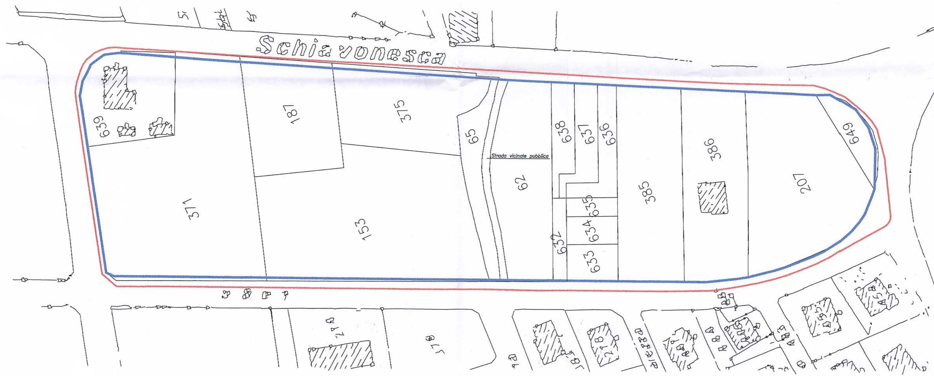
PLANIMETRIA CATASTALE 1:1000 Individuazione delle proprietà COMUNE DI VICENZA - FG. 72 - mapp. 639-371-187-153-375-65-62-632-633-634-635-636-637-638-385-386-207-649

— AMBITO D'INTERVENTO Sup. mq 31.580 Perim. ml 836 — PIANO URBANISTICO ATTUATIVO Sup. mq 28.777 Perim. ml 812 (Sup. P.U.A. come da P.R.G. per calcolo potenzialità edificatorie e relativi standards)